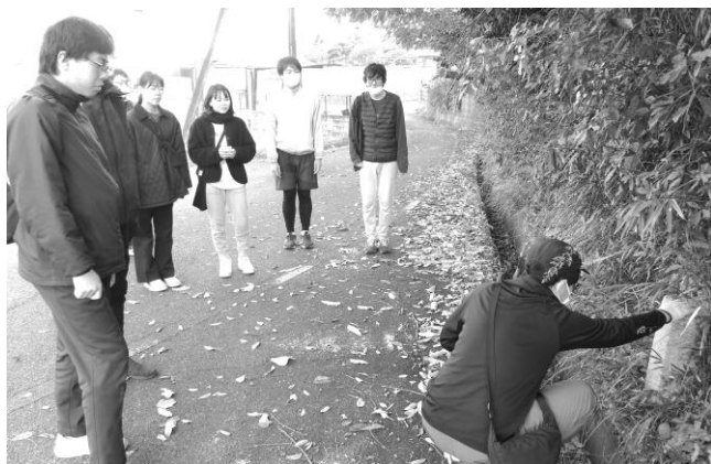
求道の日(金乃神道・道標)

第四回は、徒步行として、船着場である沙美海岸から教祖広前へ到る参拝道であつた「金乃神道」を歩き、当時参拝された人々へ思いを巡らせた。また道中、金光四神様の奥様である高清姫様のご生家(安部家)にも立ち寄り、安部家の奥城にも参拝した。