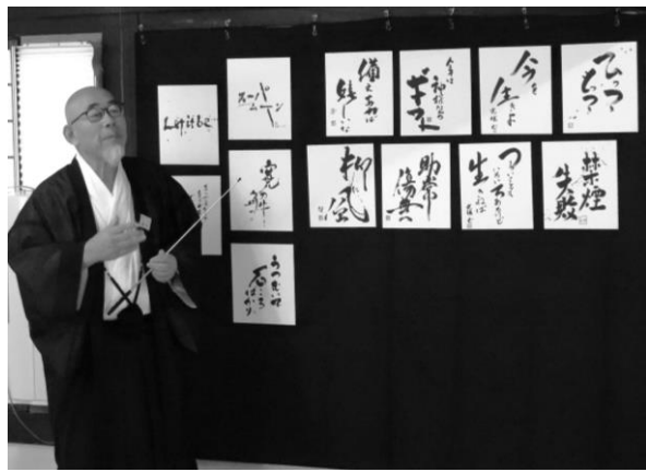
文化活動合同茶会 (書道)