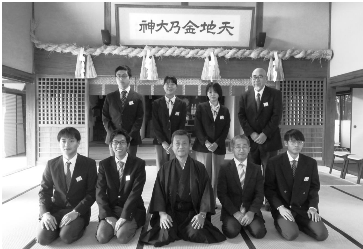
直信教会参拝 (才崎教会)

発行 金光学院 719-0111 岡山県浅口市 金光町大谷 1486 TEL (0865) 42-3115 FAX (0865) 42-3114