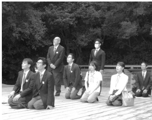
黒住教本部 (日拝所)

いただいた。さらに、他宗教への理解を深めるため、本教と同じく幕末期に開かれた黒住教の本部を訪れた。到着後、本部神殿である「大教殿」に参拝し、信仰実践として大切にされている「日拝式」が行われる「日拝所」にもご案内いただいた。さらに「宝物館・まるごとセンター」にて講話を拝聴し、貴重な展示品も拝観させていただいた。