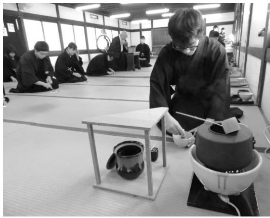
文化活動合同茶会 (茶道)

て演奏した。美しい音色を響かすことができ、典楽の楽しさを皆で味わうことができた。また、書道選択者は、そ