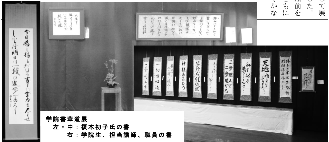
学院書華道展 左・中：榎本初子氏の書 右：学院生、担当講師、職員の書