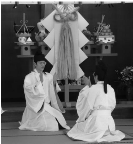
学院・生神金光大神大祭 (奉幣行事)