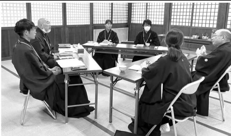
第二回 修徳殿入殿

第一回(九月)は、「教師志願の理由や、在籍教会・各家庭の信心の歩みをもとに、現在、どのような信心の流れの中にあるのかを確認する」との願いのもとに実施した。さらに、第二回