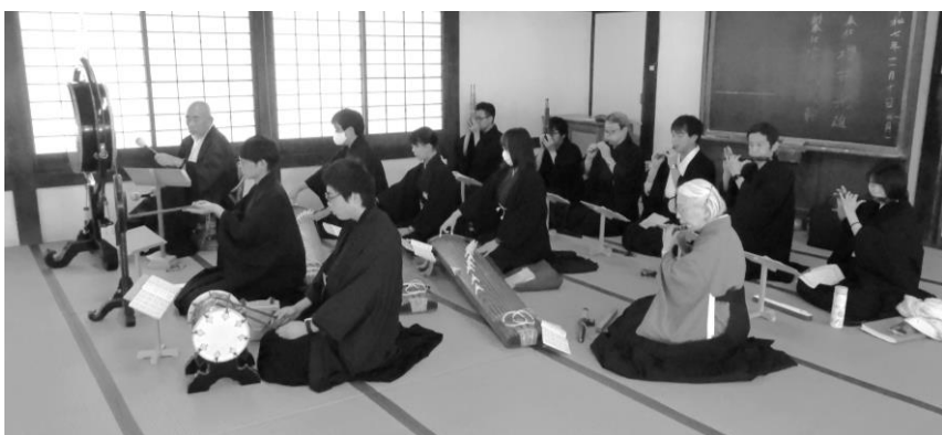
文化活動合同茶会(典楽)

十一月十日、学院広前において、第二十七回文化活動合同茶会が行われた。合同茶会は、文化活動で習得してきた成果を発表し、他の講師の先生方にも触れ合い、互いの文化活動に対する理解を深め合うことを願いとしている。今年度は、典楽を全員が履修しており、合同茶会では、全員で息を合わせ