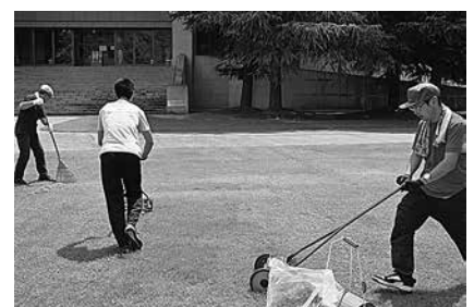
自主活動 (社会奉仕活動)