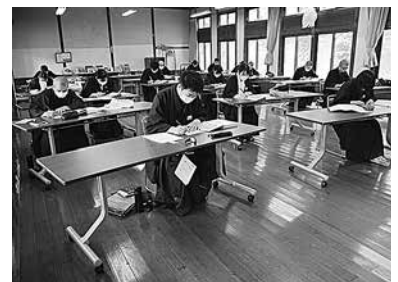
求道の日 (覚書筆写)