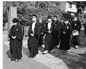
信行輔導期間 (参拝)

今年度は、毎年参加させていただいておりました金光教広島平和集会在、縮小開催となったため、学院から遙拝させていただくこととなりました。感染の拡大状況によっては、今後もこのようなカリキュラムの変更の可能性もございます。