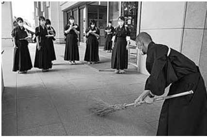
信行輔導期間 (洒掃指導)

OBの方々による実意で行き届いた指導により、本年度も順調にスタートを切ることができた。御用に当たっていただいたOBの方々には改めて御礼を申し上げたい。本年度のOBは以下