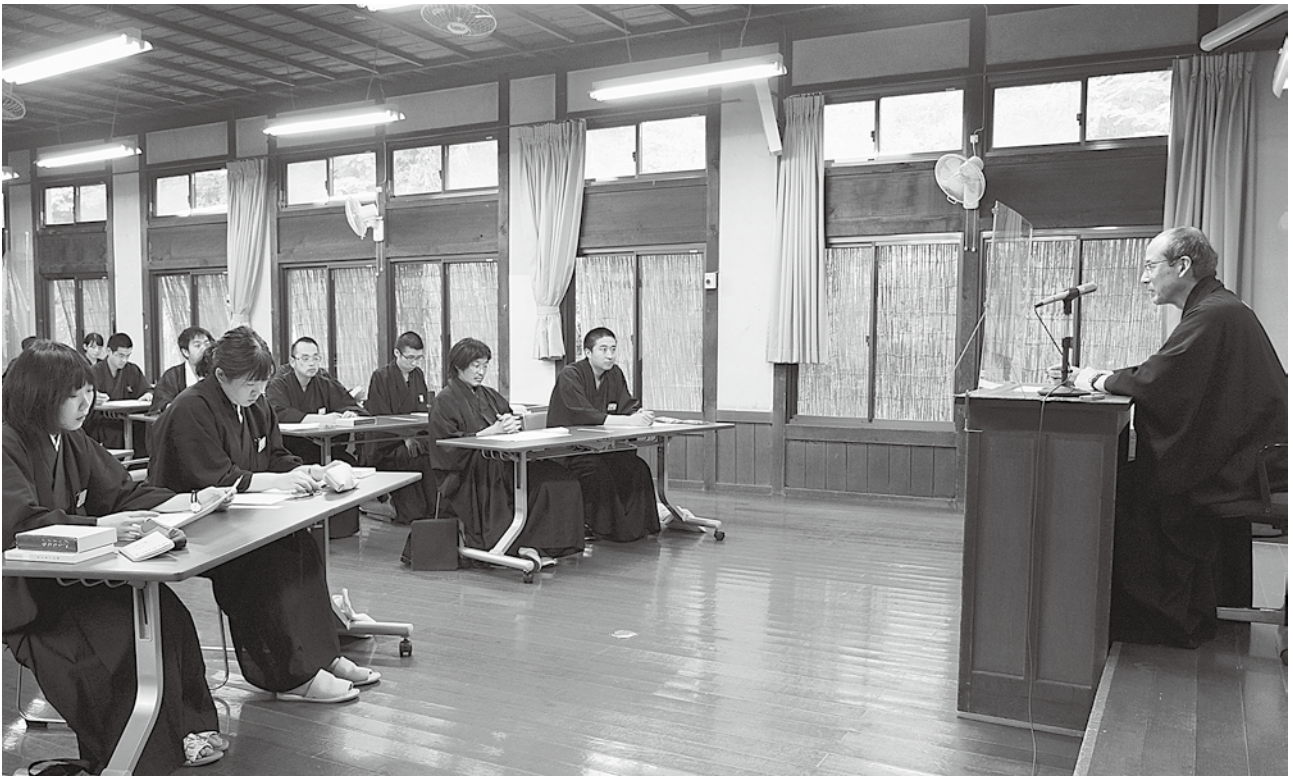
求道の日 (学院長講話)

発行 金光学院 719-0111 岡山県浅口市 金光町大谷1486 TEL (0865) 42-3115 FAX (0865) 42-3114