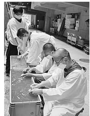
教団独立記念祭御用奉仕 (調饌係)

とは自分のする事に責任を持ち、自分のことは自分でしなければいけないと思ひ込んでいました。そう思ひながら仕事を進めていくうちに、私は自分で自分を追い込んで、体調を崩し、結局、退職することとなりました。それでも、「自分ではなければいけない」という思いを考え直すことはできませんでした。