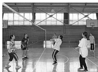
自主活動 (スポーツ大会)

学院では、教師としての基礎的素養を身につけ、深い人格形成に資することを願いとして、文化活動を設定しており、学院生は、典楽、華道、茶道、書道のいずれかを選択し、毎週水曜日の午後 realism