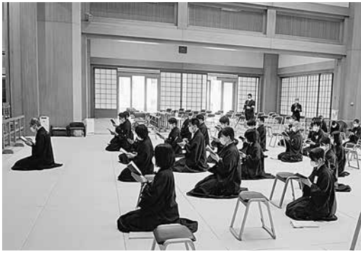
本科入学式 (本部広前御祈念)

前例のない事態に際して、保証教会長先生のご指導の下、入寮までの二週間を不要不急の外出を控えていただき、それぞれの在籍教会で修行をしていただき、その間、本人はもとより、教会ご家族の検温や健康の管理までお願いし、