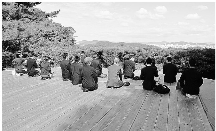
黒住教本部・日拝所

■学院秋季霊祭・生神金光大神大祭 本部広前のごひれいを受け、学院広前において、九月二十五日に秋季霊祭、十月十四日に立教百六十年生神金光大神大祭が執り行われた。 これらの祭典は、神様と学院霊舎に祀られる物故職員・学院生を合わせて二百二十一柱の霊神様のお働きを受け、ここまでの学院修行を進められてきたことへのお礼と真心を現す祭典として奉仕される。 祭典に臨むにあたり、祭員は、少しで