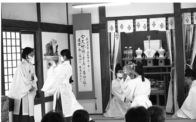
秋季霊祭(献饌行事)

■学院秋季霊祭・生神金光大神大祭 本部広前のごひれいを受け、学院広前において、九月二十五日に秋季霊祭、十月十四日に立教百六十年生神金光大神大祭が執り行われた。 これらの祭典は、神様と学院霊舎に祀られる物故職員・学院生を合わせて二百二十一柱の霊神様のお働きを受け、ここまでの学院修行を進められてきたことへのお礼と真心を現す祭典として奉仕される。 祭典に臨むにあたり、祭員は、少しで