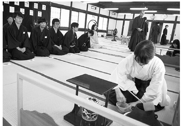
文化活動合同茶会

十一月六日、学院広前において、文化 活動の合同茶会が行われた。合同茶会は、 前期を通して文化活動で習得してきた成 果を発表し、ほかの講師の先生方にも触 れ合い、ほかの文化活動に対する理解を 深めることを願いとしている。