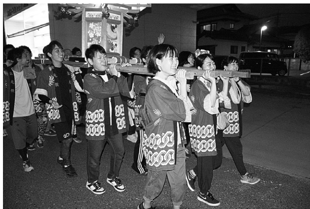
教祖生誕奉祝行事