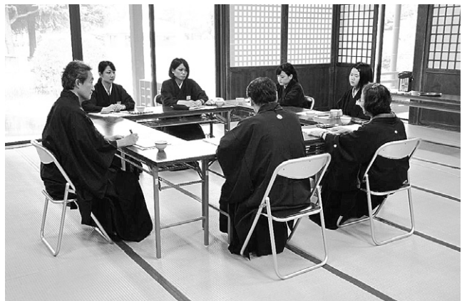
女子修徳殿入殿(第1回)

第一回(九月)は、「教師志願の理由や、在籍教会・各家庭の信心の歩みをもとに、現在、どのような信心の流れの中にあるのかを確認する」との願いにより、年齢順に分かれた班編制で実施した。第二回(十二月)は、「前期に学んだことをもとに、本教の信心生活について求め合う」