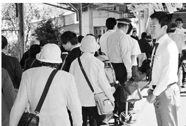
立教160年生神金光大神大祭御用奉仕