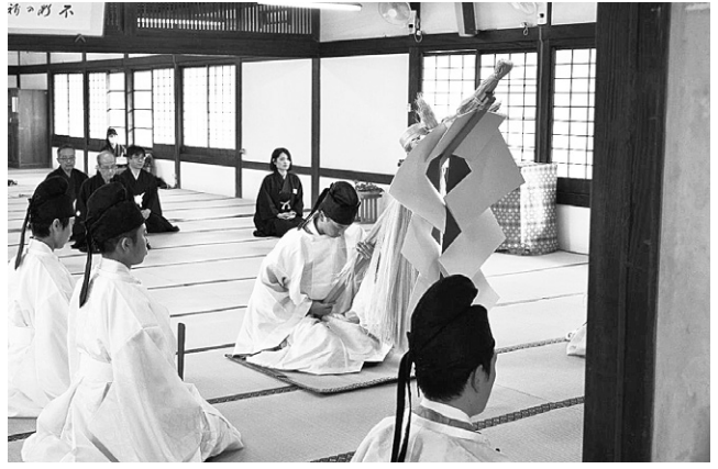
立教160年生神金光大神大祭(奉幣行事)