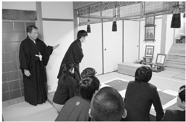
六条院教会・旧広前