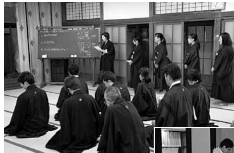
自主企画 (作法の確認)