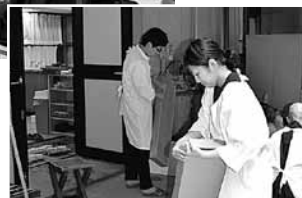
教団独立記念祭 御用奉仕