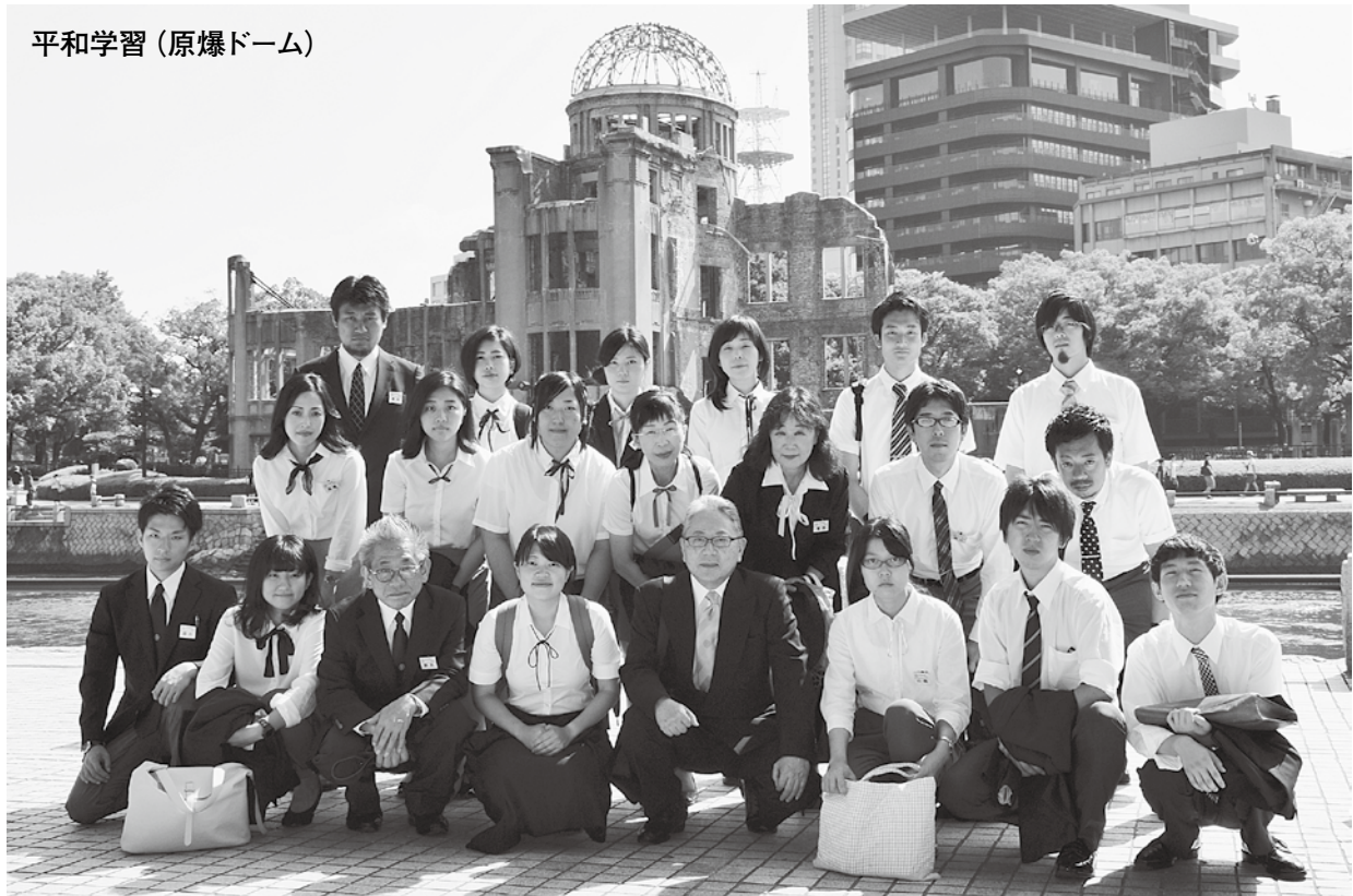
平和学習 (原爆ドーム)

発行 金光学院 719-0111 岡山県浅口市 金光町大谷1486 TEL (0865) 42-3115 FAX (0865) 42-3114