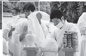
教団独立記念祭 御用奉仕