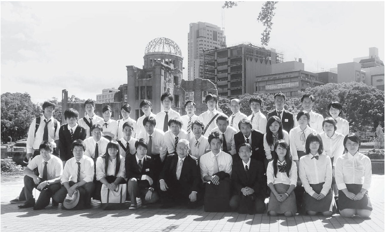
広島平和学習 (原爆ドーム)

発行 金光学院 719-0111 岡山県浅口市 金光町大谷1486 TEL (0865) 42-3115 FAX (0865) 42-3114