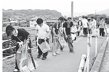
全教勢をそろえて社会奉仕の日

らの気付きと得ながら切磋琢磨してきました。また、班長を始め、奉仕や係など様々な御用を頂く中で、毎朝目覚めることが、今日も神様に御修行を許されている、つまり今日一日生きることを許されているように思え、それに対して感謝できるようになって来ました。これからこの学院生活、様々な事に対して