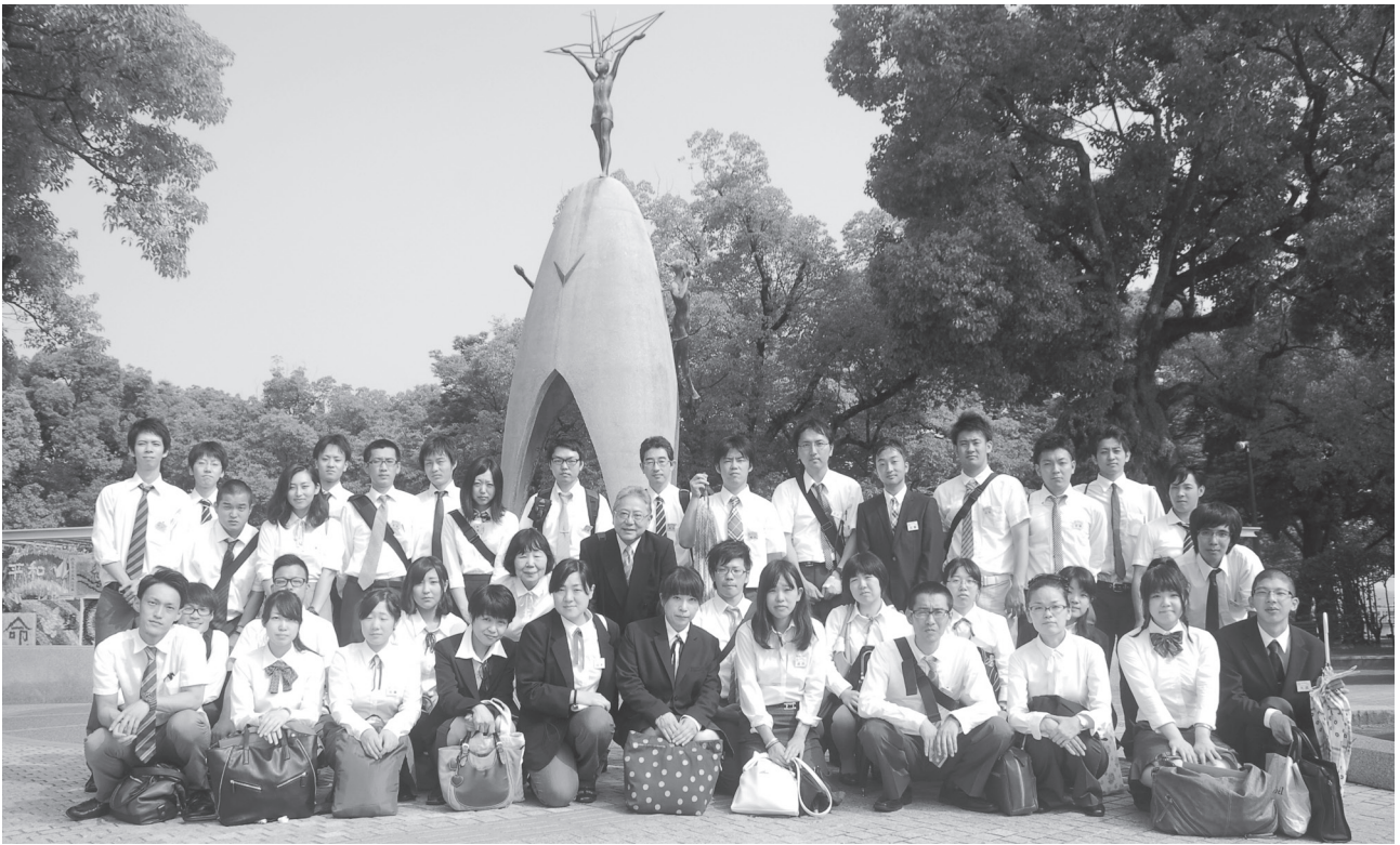
広島平和学習 (原爆の子の像)

発行 金光学院 719-0111 岡山県浅口市 金光町大谷1486 TEL (0865) 42-3115 FAX (0865) 42-3114