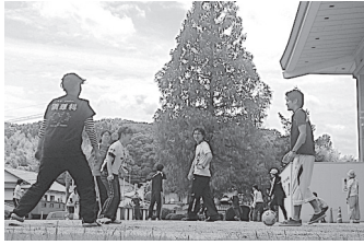
自主企画(フットサル)

毎日、学院広前で奉唱させて頂いている「学院生活の願い」の一節に、「教祖の教えに基づいて天地の道理を学び、人間のあらゆる問題を信心の眼で見る力を養いつつ、天地書附を体して、神の願いに生きる」とあります。神様は、私にどの様な願いをかけて下さっておられるのかを悟らせて頂く為に、学院生活で起る